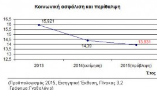
Εικόνα 5. Κοινωνική ασφάλιση και περίθαλψη στον Προϋπολογισμό 2015.

Παρότι στις δεσμεύσεις τους υπάρχει το ενιαίο μισθολόγιο, όπως και άλλες παρεμβάσεις που θα έπρεπε να οδηγούν στην εξοικονόμηση εκατοντάδων εκατομμυρίων ευρώ από το κράτος, έτσι ώστε να μην χρειάζεται να κόβονται οριζόντια οι συντάξεις των αδυνάμων και να μην τσακίζονται φορολογικά οι παραγωγικές προσπάθειες στην οικονομία, που είναι και οι μόνες εγγυήσεις για την ανάκαμψη - και βέβαια μέσα σε ένα αναθεωρημένο πλαίσιο για το ύψος των πλεονασμάτων που έχουν κακώς συμφωνηθεί.